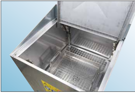
Edelstahl-Reinigungsbecken mit herausnehmbarem Edelstahl-Korb