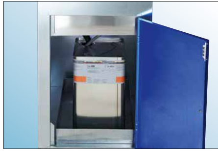
Im Gerät integrierter Stauraum für Reinigungsmittel (Reinigungsmittel nicht im Lieferumfang enthalten)