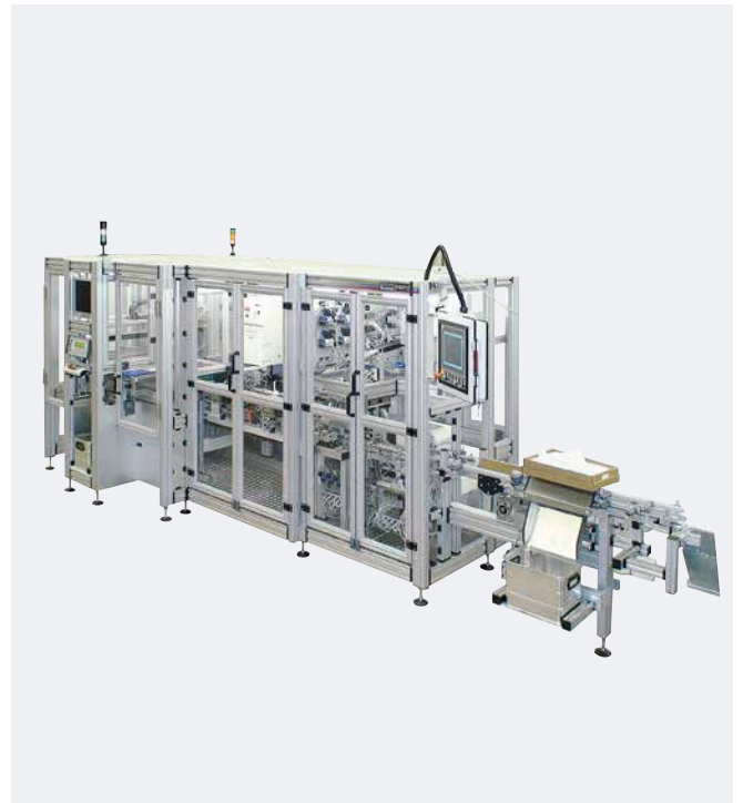
Automation für Ampullenstrips mit RAPID 2000/130