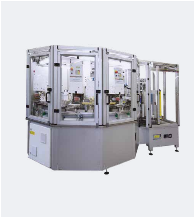
Automation für Inhalator-Zählringe mit RAPID 2000/90