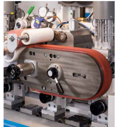
Druckwerk mit Riementampon

Die Kapazität der CONTINUOUS CIRCULAR beträgt – abhängig von den zu bedruckenden Teilen – bis zu 15 000 Teile/Stunde.