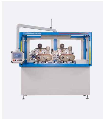
CONTINUOUS CIRCULAR mit 2 Druckwerken

Die CONTINUOUS CIRCULAR ist sowohl als Einfarben- wie auch als Mehrfarben-Tampondruckmaschine erhältlich. Höchste und brillante