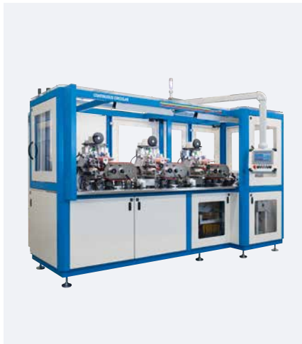
CONTINUOUS CIRCULAR mit 3 Druckwerken

Die CONTINUOUS CIRCULAR mit ihrem 360° Rundumdruck überzeugt durch ihre Passergenauigkeit. Der kontinuierliche Druckprozess sorgt für erhöhte Prozesskontrolle und damit einhergehend für bessere Qualität und höhere Präzision als bei herkömmlichen Tampondrucklösungen.