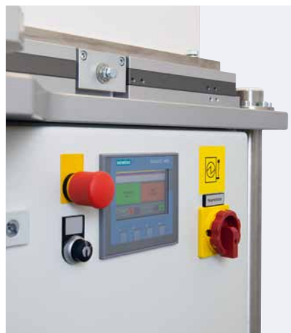
Touchpanel zur Bedienung des Schalttellers

Zusammen mit der praktischen Ablagefläche ermöglicht der höhenverstellbare Winkeltisch